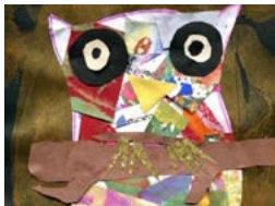
Shelley Blake-Knox Midnight Owl, Comox Valley