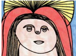
Gordon Mills La Vierge Marie II, Cape Breton