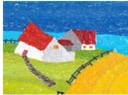
Christiane Bernard Promenade dans Bellechasse, Le Printemps