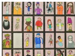
Atelier Alizé Regarde-toi dans le miroir, Montréal