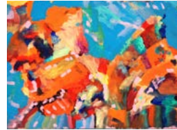
Céline Pépin Sans titre, Mauricie