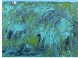
Douglas Brown Océan orangeux, Homefires