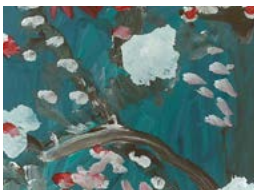
Albert Vinet Fleurs de cerisier, Winnipeg