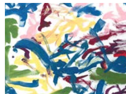
Chantal Pinault L'énergie du printemps, North Bay