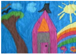
Gilles Dubé Mon foyer: L'Aurore Boréale, Abitibi-Témiscamingue