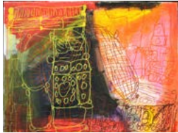
Sachan Sarwal Retour vers le futur, Antigonish