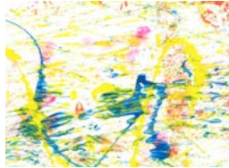
Céline Pinel Sans titre, L'Étoile