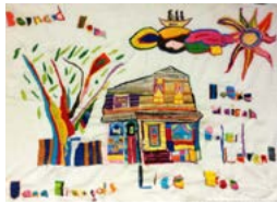
Lise Charlebois Le soleil levant, Agapè