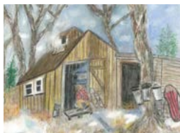
Emily Arbeau Cabane à sucre, Fredericton